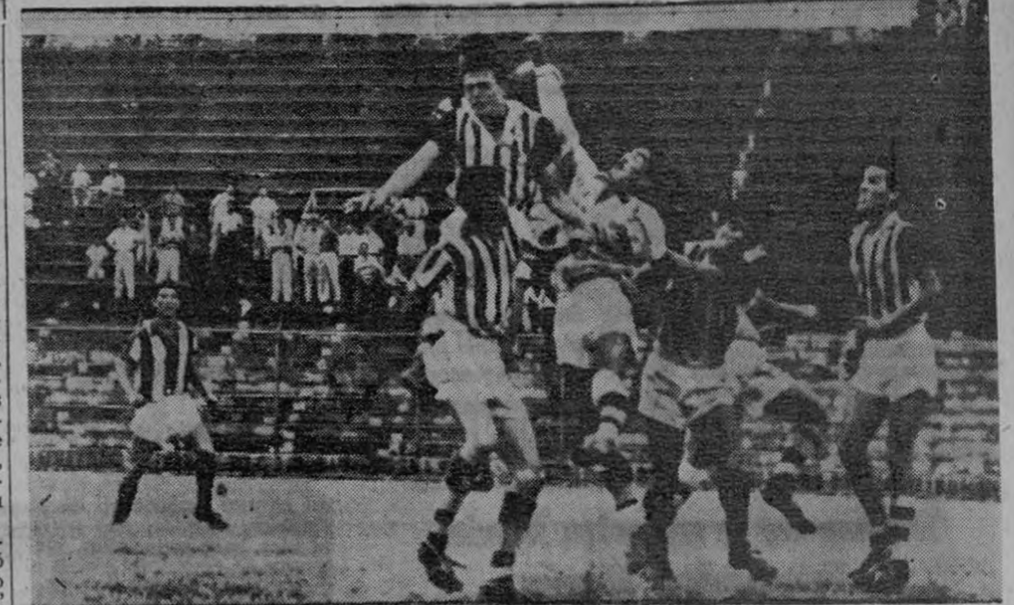
CORNER CONTRA URUGUAY.—Armijo ha lanzado un corner contra la portería de Chito Núñez, éste sale y despeja de puños bien protegido por sus defensas

FINQUERO! AGRICULTOR! LECHERO! AVICULTOR!